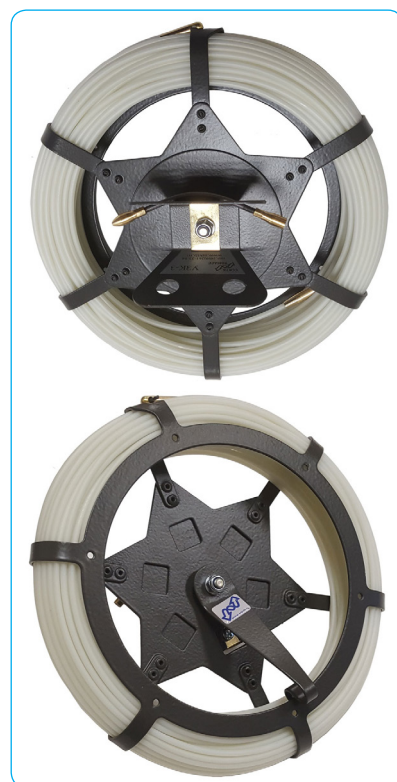
Устройство Мини УЗК